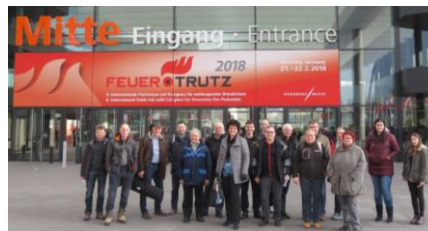
Na obisku sejma FeuerTRUTZ