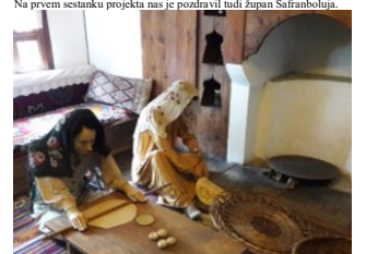
Safranbolu je svatovno znan po bogati kulturni dediščini.