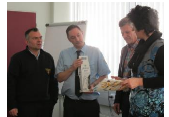
Pri poklicnih gasilcih v Nürnbergu