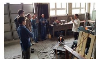
Usposabljanje vodilnih predavateljev na GB Ljubljana

Več informacij najdete na www.szpv.si/usposabljanja/vroca-dela .