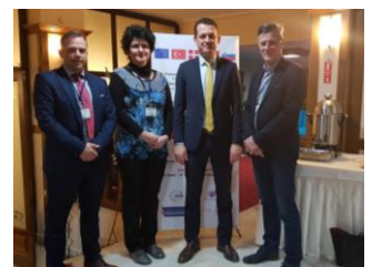
Na prvem sestanku projekta nas je pozdravil tudi župan Safranboluja.

SZPV s sodelovanjem pri projektu nadaljuje dolgoletno delo na področju požarne varnosti stavb kulturne dediščine. V zadnjih 15 letih smo organizirali več konferenc in seminarjev ter pripravili smernico CFPA-E št 30.