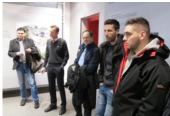
V okviru smo obiskali strokovnjake za požarno varnost v Audiju v Ingolstadtu.

V Novičniku objavljamo nekaj fotografij kot povabilo k branju poročila z ekskurzije, ki bo objavljeno v reviji Požar 1-2018.